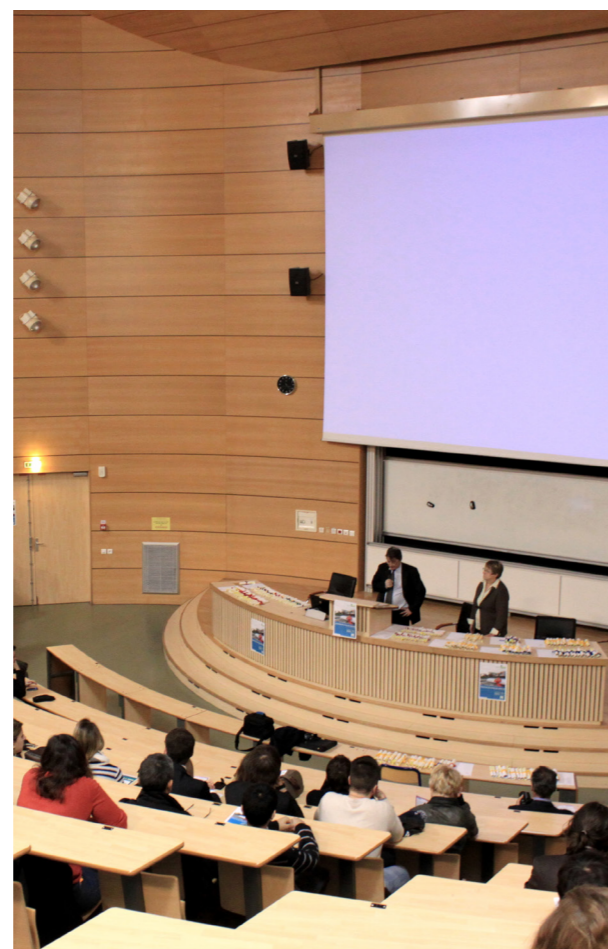
Cérémonie de remise des diplômes

Ces enseignements donnent d'excellents résultats pour l'obtention rapide d'un emploi après la fin des études. Ainsi, le taux d'insertion professionnelle du Master Gestion de l'archivage (GDA), reconnu « Pépites 2014 de la fac » par le Nouvel Observateur, est de 100 %.